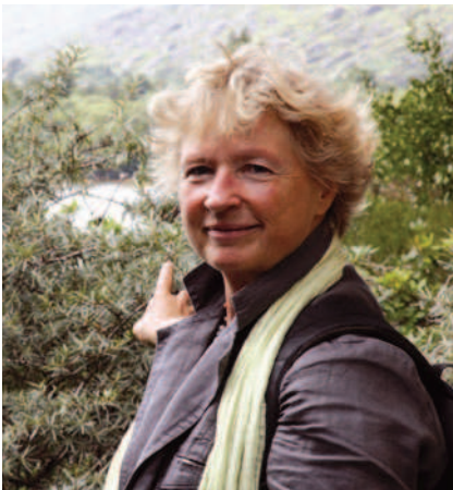
Abb. 2 Der Sanddorn als echter „Global-Player“.

sind aber z. B. Adaptogene wie Ginseng oder Taigawurzel oder die Echinacea aus Nordamerika. Wovon ich gar nichts halte sind Modepflanzen, die auf einmal aufkommen und die Welt retten sollen, deren Anpreiser und Verkäufer sich jedoch vor allem eine Rettung ihres Kontos erhoffen. Und: Ohne genaues Überprüfen sollte man auch nicht einfach generell alle „Wirkungen“ von Pflanzen aus z. B. Asien oder Südamerika auf Mitteleuropa übertragen.